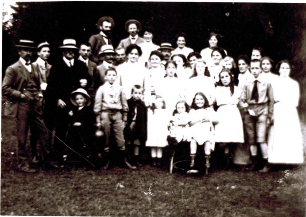
"L'abbaye du 10 août"