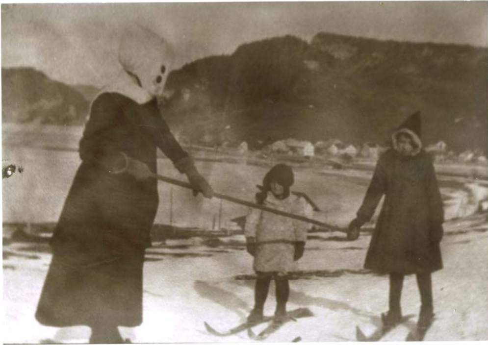
Les filles Mounoud

Fréda épouse Auguste Mounoud. Ils auront cinq enfants.