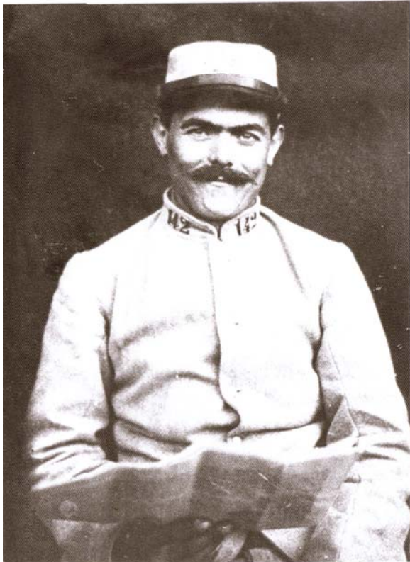
Interné d'Auvergne, Bieles, logeait au Grand-Hôtel du Pont.